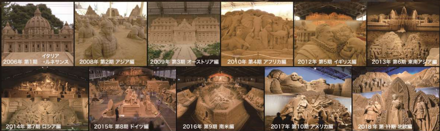
2006年 第1期 イタリア・ルネサンス

砂の美術館は砂像彫刻を専門に展示する世界で唯一の美術館です。2006年に砂像の展示をスタートさせて以来、毎年テーマをかえて世界トップクラスの彫刻家が繊細で存在感のある作品を創り出し、多くの来場者に衝撃と感動を与えてきました。2019年 第12期展示のテーマは「砂で世界旅行・南アジア編」。多様な文化と信仰が息づく南アジアの様子を砂像で表現しました。